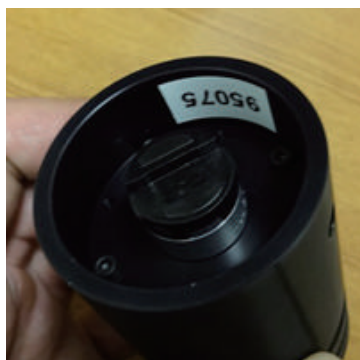
フォーカスドライブ側

顕微鏡側（写真左）とフォーカスドライブ側（写真右）にそれぞれパーツを取り付け、それらを組み合わせてはめ込みます（写真下）。