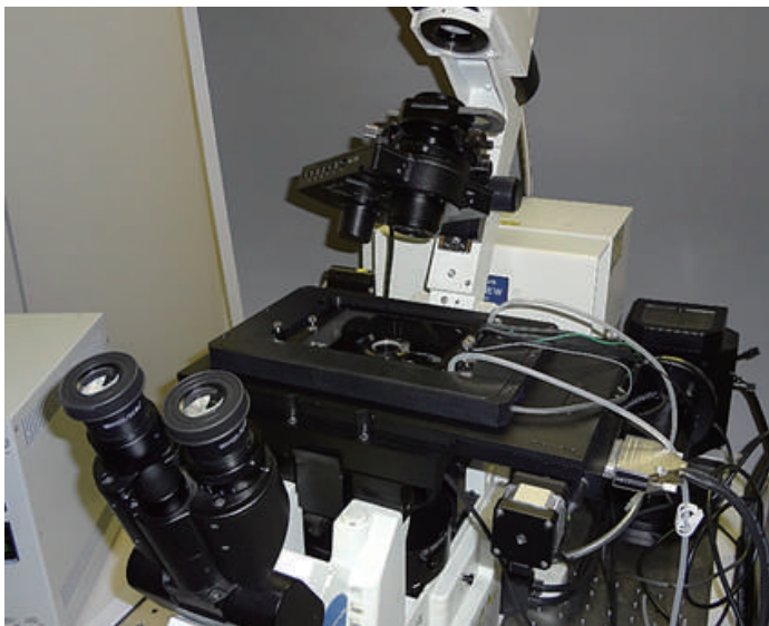
IX81 に装着した H117 ステージ